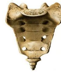
Vragenronde 7 - Vraag 4