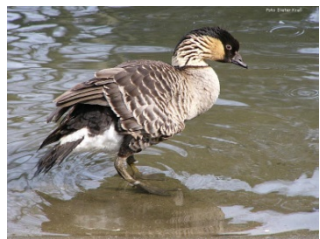
Superronde - Vraag 4B