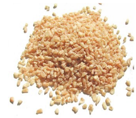
Superronde - Vraag 9B