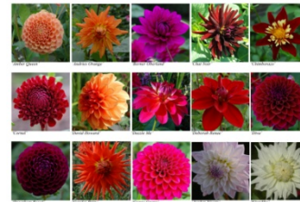
Vragenronde 8 - Vraag 4