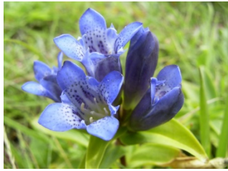
Vragenronde 6 - Vraag 4