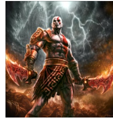
Vragenronde 7 - Vraag 1