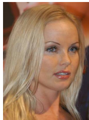
Vragenronde 7 - Vraag 6