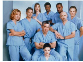
Vragenronde 6 - Vraag 6