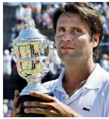
Vragenronde 7 - Vraag 7