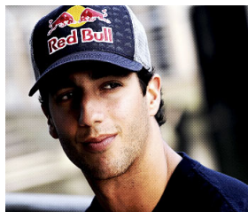
Vragenronde 8 - Vraag 7