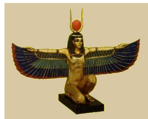
Superronde - Vraag 3A