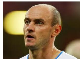
Superronde - Vraag 7B