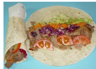
Superronde - Vraag 9A