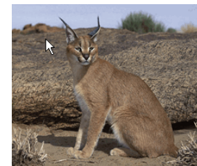
Superronde - Vraag 4A