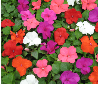
VRAAG 4 - A