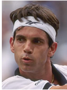
VRAAG 7 - A