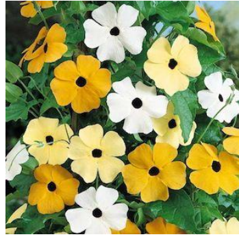
VRAAG 4 - B