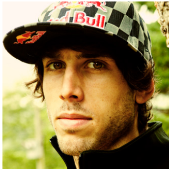
VRAAG 7 - B