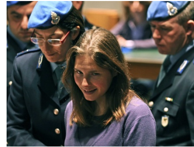
RONDE 7 - VRAAG 1