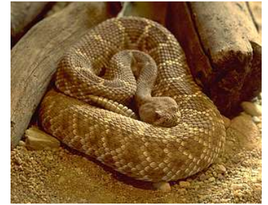
RONDE 6 - VRAAG 4