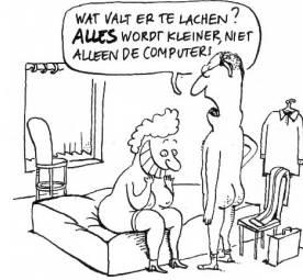
RONDE 5 - VRAAG 8