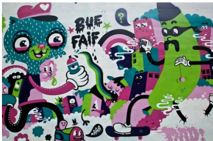
RONDE 7 - VRAAG 8