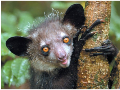
RONDE 5 - VRAAG 4