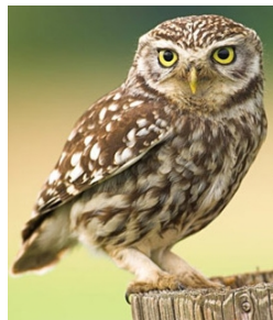
RONDE 8 - VRAAG 4