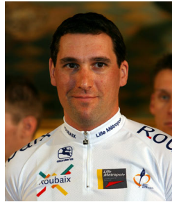
RONDE 6 - VRAAG 7