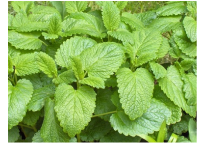
RONDE 7 - VRAAG 4