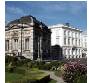
RONDE 8 - VRAAG 9