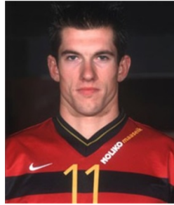
RONDE 5 - VRAAG 7