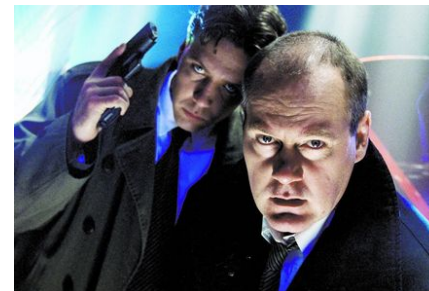
RONDE 8 - VRAAG 6