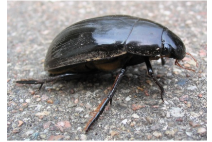
RONDE 2 - VRAAG 4