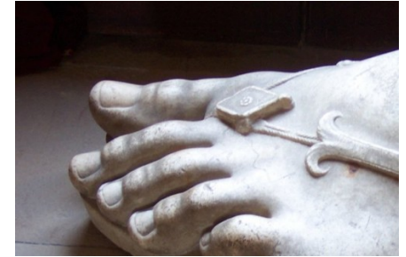
RONDE 3 - VRAAG 5