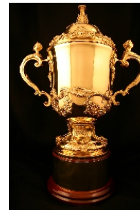
RONDE 4 - VRAAG 7