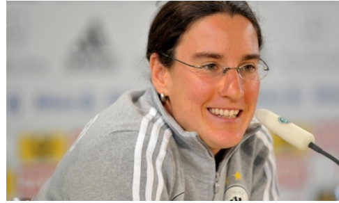
RONDE 2 - VRAAG 1