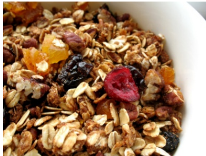
RONDE 3 - VRAAG 9