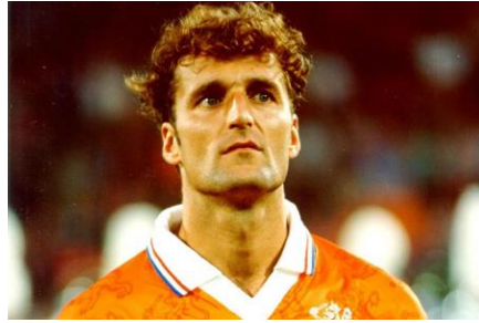
RONDE 1 - VRAAG 7