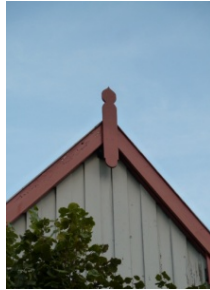
RONDE 2 - VRAAG 9