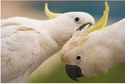
RONDE 1 - VRAAG 4