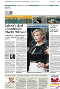
RONDE 4 - VRAAG 9