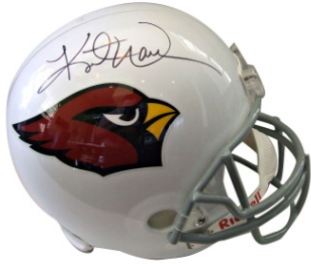
RONDE 2 - VRAAG 7