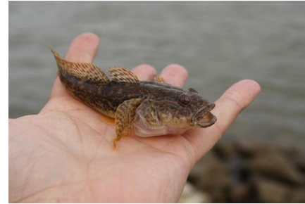
RONDE 3 - VRAAG 4